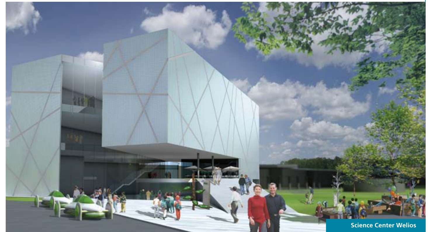
Science Center Welios

[E] gis@aquaserv.cz [M] +420 724 032 409