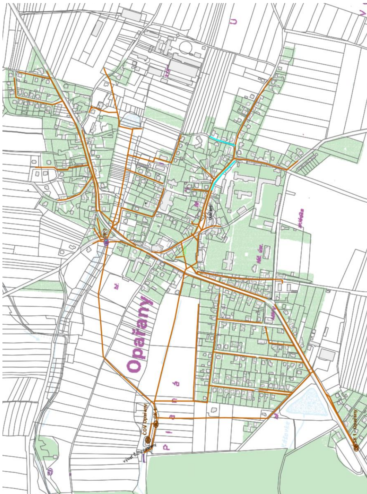
Orientační schéma kanalizační sítě městyse Opařany :